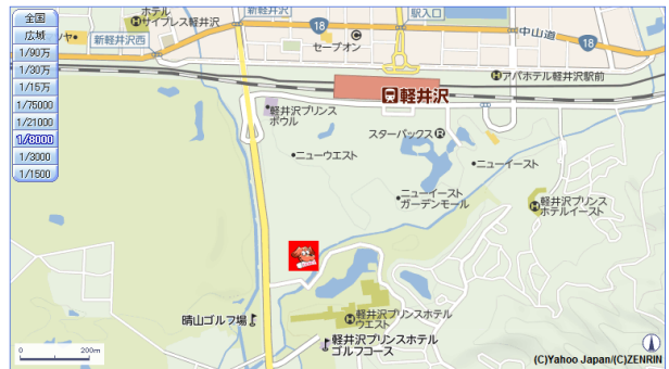
図2 軽井沢バス乗り場