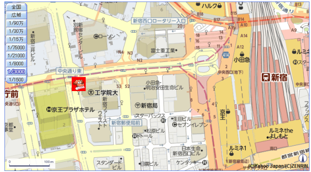
図1 新宿西口工学院大 学前バス乗り場